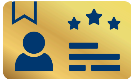
بطاقة اصدقاء قدرات

يحصل المشترك على بطاقة أصدقاء قدرات بمميزاتها (خصم 25% لبرامج الأكاديمية لمدة سنتين).